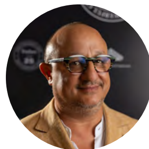
Dalla Trinacria al mondo