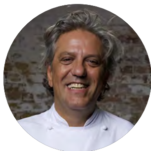
Premio Speciale: Chef senza confini

Grande protagonista fuori dal territorio nazionale, Giorgio Locatelli assimila la cucina italiana al concetto di cultura riaprendo il suo ristorante all'interno di uno dei musei d'arte più importanti del mondo.