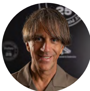
Genius loci lombardo