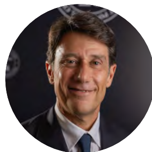
Premio Speciale: Esploratore del gusto italiano

Il suo programma Little Big Italy racconta in modo straordinario la cucina italiana del mondo aggiungendo ironia e competenza, mette in prosa quanto c'è nel piatto. A Roma, con il ristorante di famiglia l'Antica Pesa incanta il mondo con composta disinvoltura.