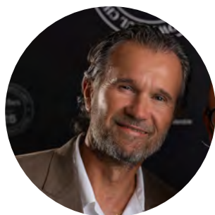
Da Milano al mondo